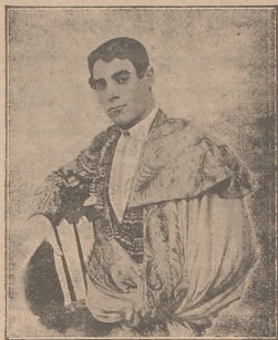
Rafael Molina (Lagartijo)