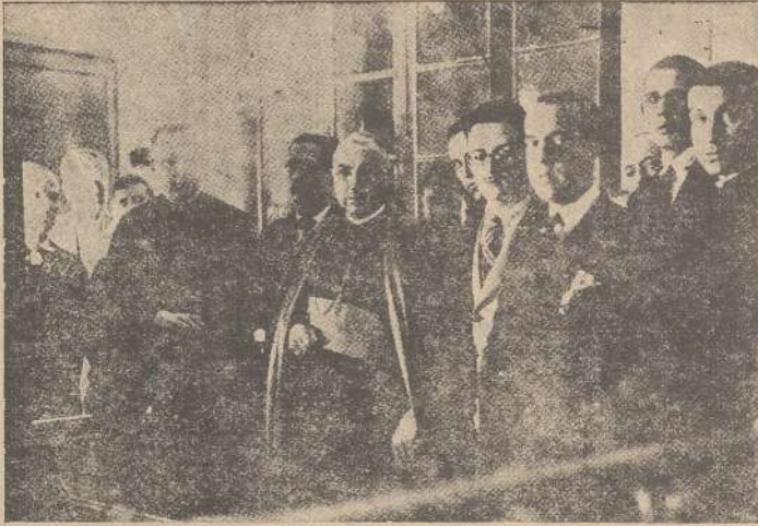
El Obispo de la Diócesis se ha dignado honrar nuestra casa con su visita. Después de recorrer todas las dependencias y presenciar el funcionamiento de la rotativa, aparece aquí acompañado por nuestro director y gerente