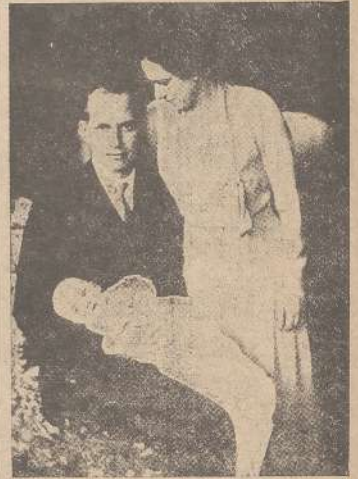
El archiduque Antonio de Habsburgo y la princesa Elena de Rumania ya tienen un heredero. He aquí al pequeño archiduque Esteban, en brazos de su padre