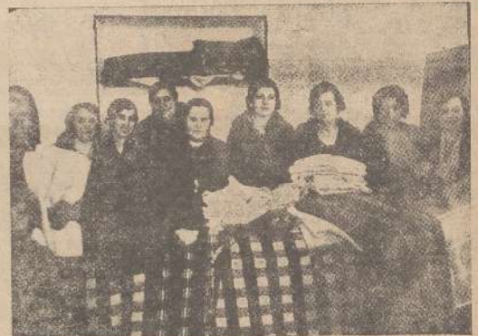
ALMENDRALEJO.—La Junta directiva de Acción Popular femenina en el reparto de ropas a los niños, con motivo de las fiestas de Navidad