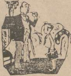
—Papá, ¿por qué caen todas las cosas? —Por la ley de la gravedad. —Y antes de que aprobasen esa ley, ¿qué pasaba? «Everybody's», Londres