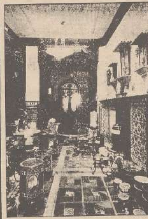
Domingo Ullgado Lera San Juan, 14 Badajoz

Mosaicos, Azulejos, Cementos, Loza sanitaria, Tubería de Gres, Baldosas de Cristal, y otros materiales de construcción