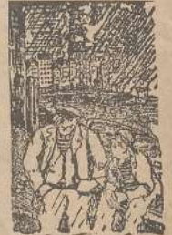
—¿Qué le ha pasado? —Que he roto el tratado de paz con mi mujer. De «Moustique», Charleroi