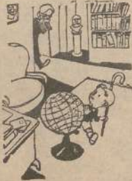
—¿Qué estás haciendo en mi despacho? —Estoy entremetido para la vuelta al mundo, papá. De «Lustige», Leipzig