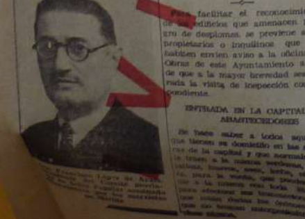
Entrada en la capital de abastecedores

La entrada de abastecedores de alimentos en la ciudad