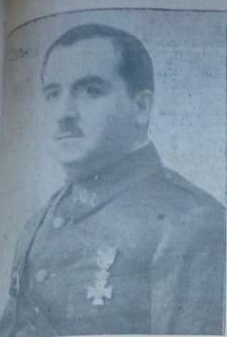
Don Benito de Lásio, comandante de Infantería retirado, nombrado gobernador civil de la provincia