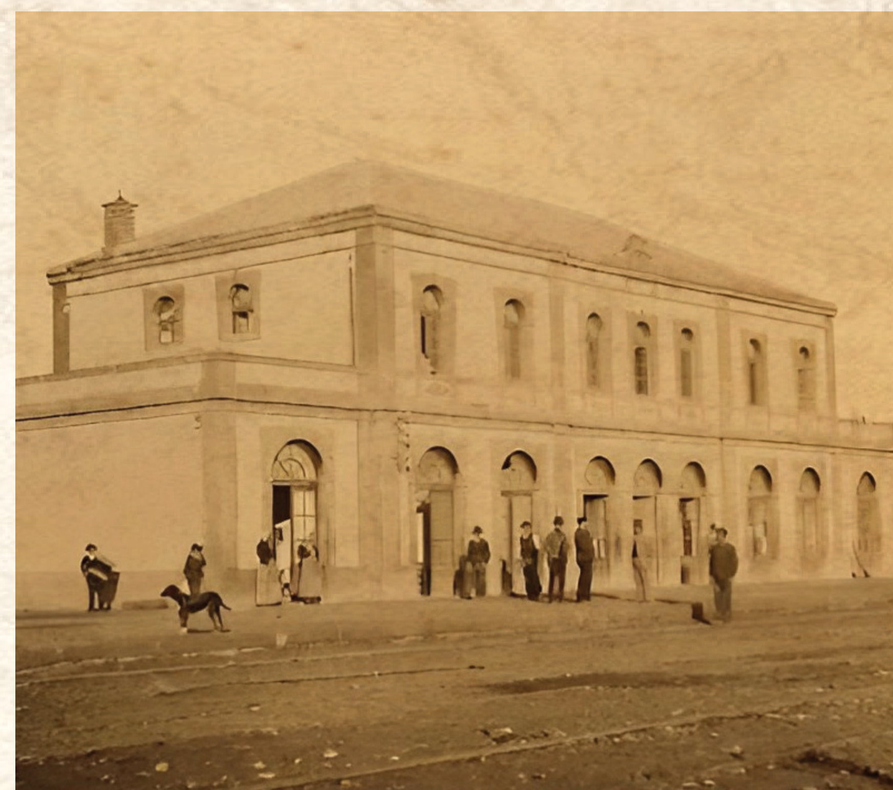
Estación de Fregenal de la Sierra, uno de los últimos lugares de concentración de los huidos.