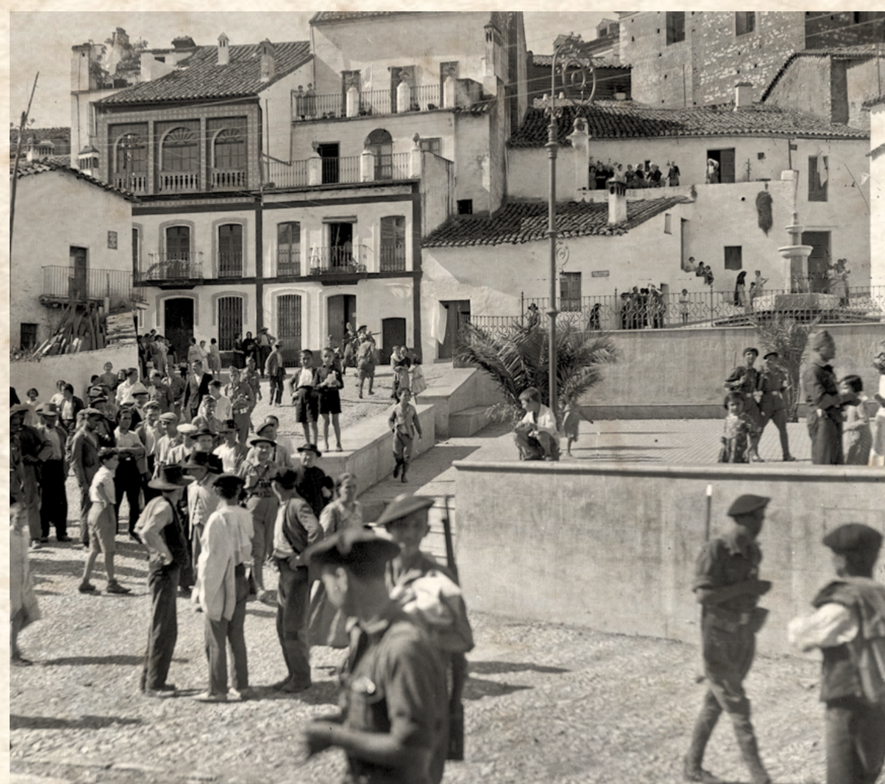
Ocupación de Galarzo (Huelva).

Tras la toma de Badajoz, el número de los huidos se incrementó muy notablemente. Durante algunos días se concentraron en Olivenza, pero la ocupación de ésta y de La Albuera el 17 de agosto, de Almendral y Torre de Miguel Sesmero el 19 y de Feria y Fuente del Maestre el 20, provocaron nuevas huidas hacia el sur. Durante la primera quincena de agosto los golpistas se habían hecho, además, con el control de Almendral, Torre de Miguel Sesmero, Feria, Santa Marta de los Barros, Villalba de los Barros, Solana de los Barros, Valverde de Leganés, Cheles, Corte de Peleas, Alconchel, Barcarrota, Higuera de Vargas, Villanueva del Fresno, Salvaleón y Salvatierra de los Barros. Estas conquistas dificultaban más aún los movimientos de los huidos, que tuvieron que buscar como refugio las localidades más meridionales de Burguillos del Cerro, Fregenal de la Sierra y Jerez de los Caballeros.