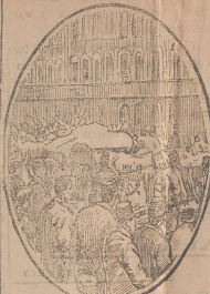
Tropas turcas saliendo del cuartel de Taxin «Constantinopla» para embarcar con dirección a Trípoli.